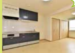
▲キレイで解放感のあるお部屋。

自由度の高い生活を送りながら、安否確認や生活相談などを受けることができる施設です。