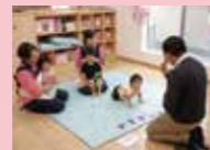
▲COCO墊のインストラクターによる英語レッスンも行っていきます。