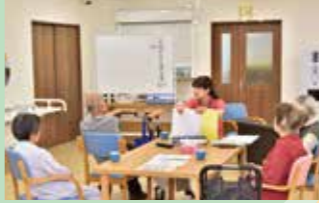
▲明るいホールに皆の笑い声が響きます。

専用のオープンキッチンがあるので、出来立てのものをすぐに食卓へ。料理を作っている過程の「おい!」も食欲増進に役かっています。