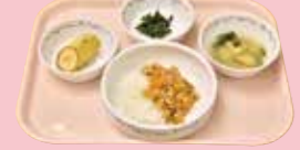
▲自園調理で年齢別の摂取機能に応じた食事を提供。アレルギー対応もしています。