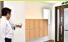
▲しっかりしたセキュリティシステムで安心。